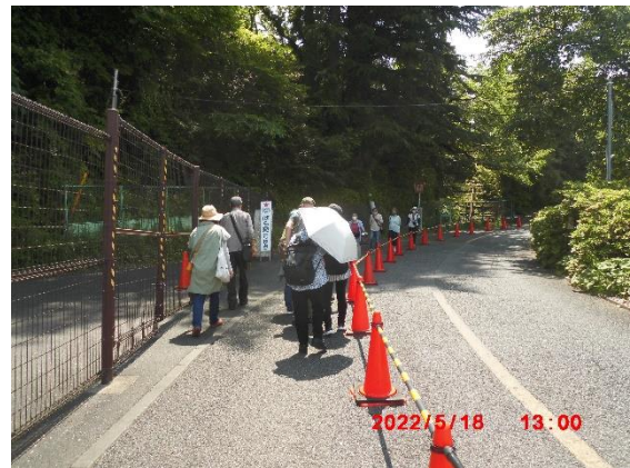
苑内には緩い坂道を登っていきます