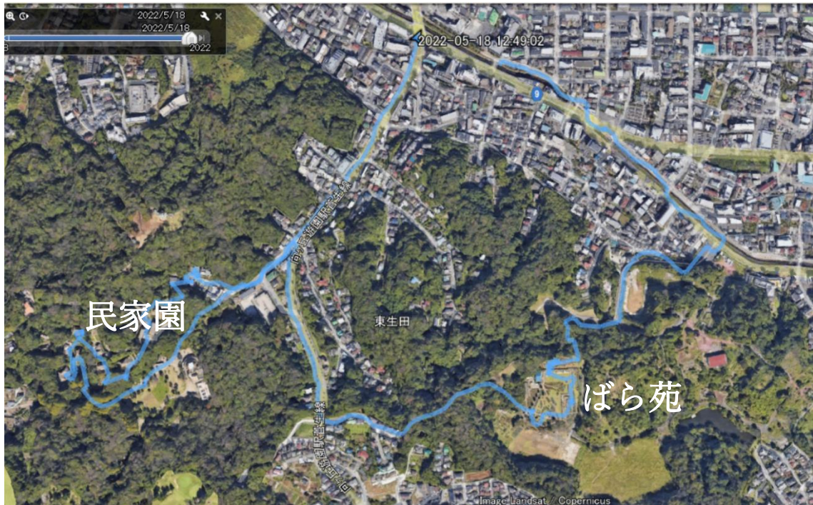
グーグルアース…青い線が歩いた軌跡