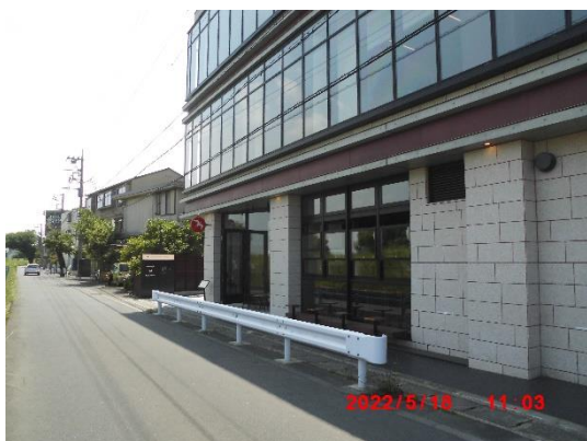
多摩川沿いに面した柏屋