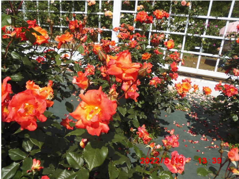
プリンセス・ミチコ イギリス 1966年。デクソン作。皇太子妃 美智子妃 殿下にささげた名前だそうです。看板より。