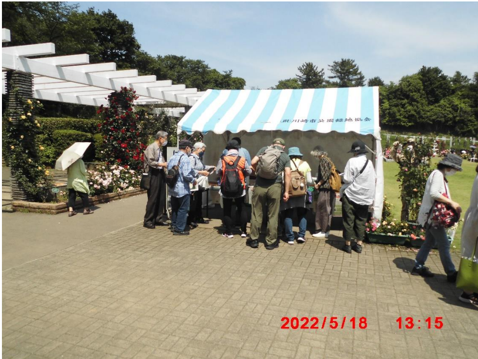
テントサイトで寄付金の協力とパンフレットと朝顔の種をいただきました。