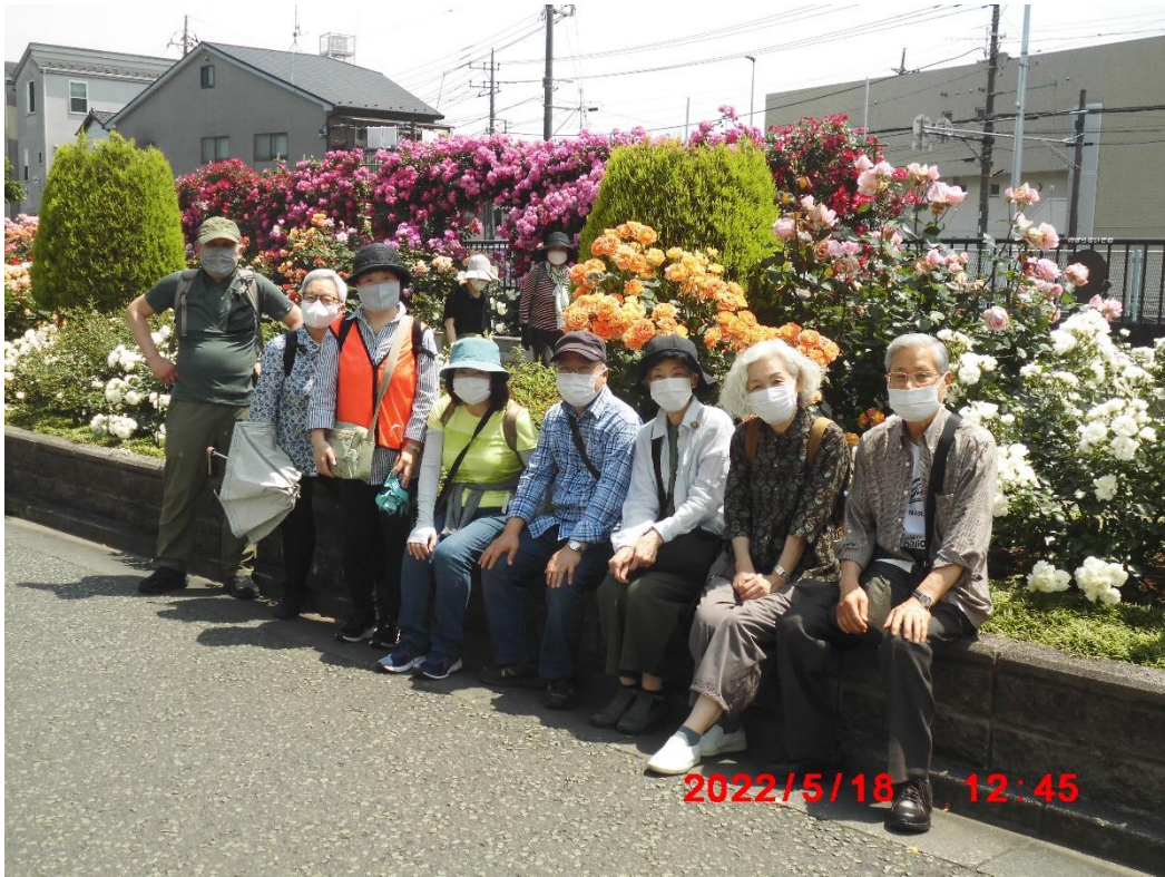
ばら苑アクセス道路