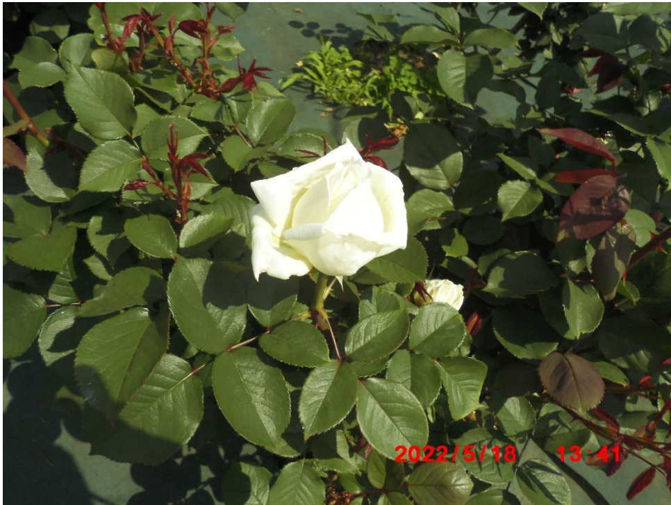
ロイヤルプリンセス フランス 2002年 フルーティなピーチ、アプリコット（あんず）などをイメージさせる香りだそうです。