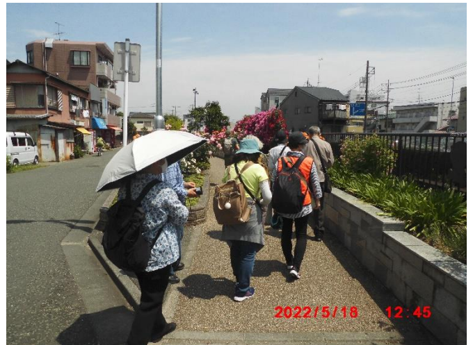
ばら苑アクセスロードで薔薇を鑑賞しながらばら苑に向かいます。