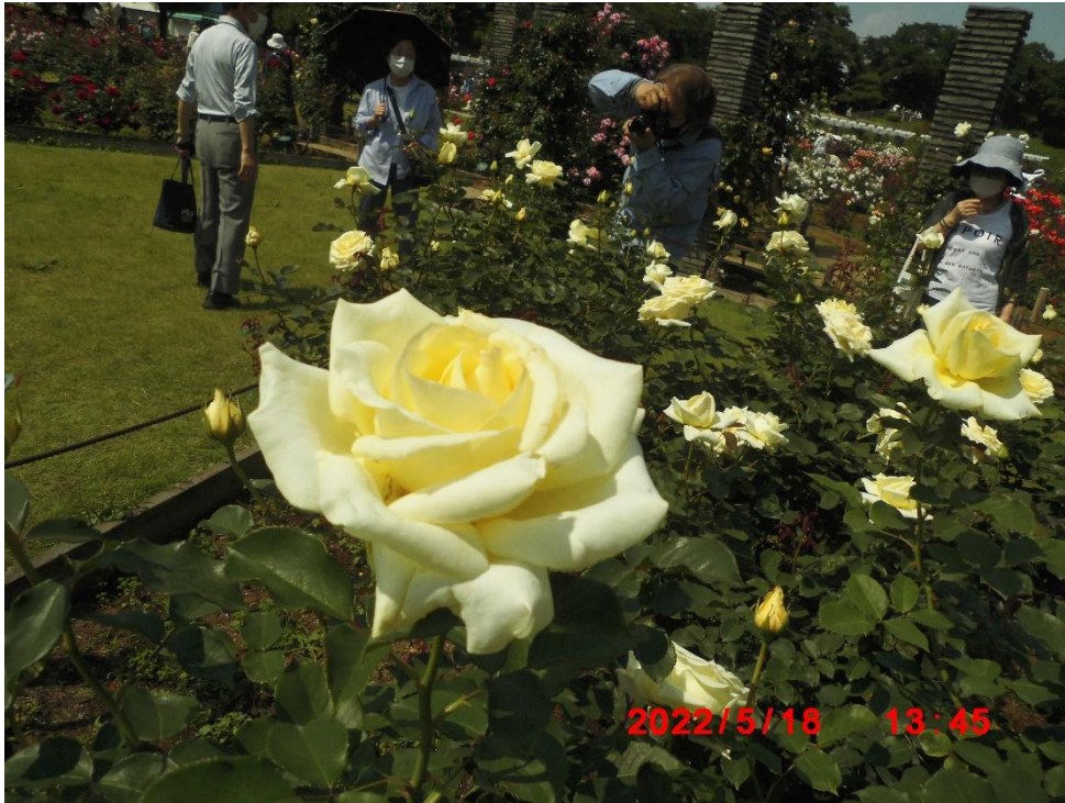
エリナ イギリス 1989年 2006年殿堂入り いただいたパンフレットの表紙に飾られていた薔薇