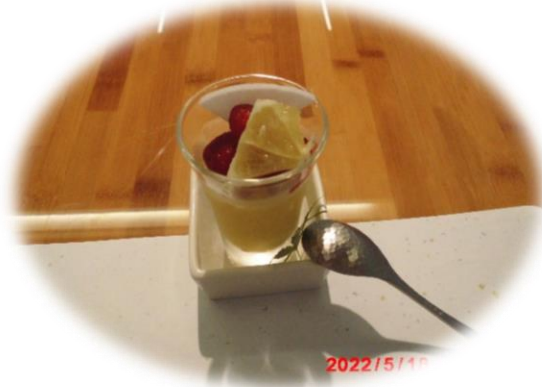
デザート…苺、レモン、プリン