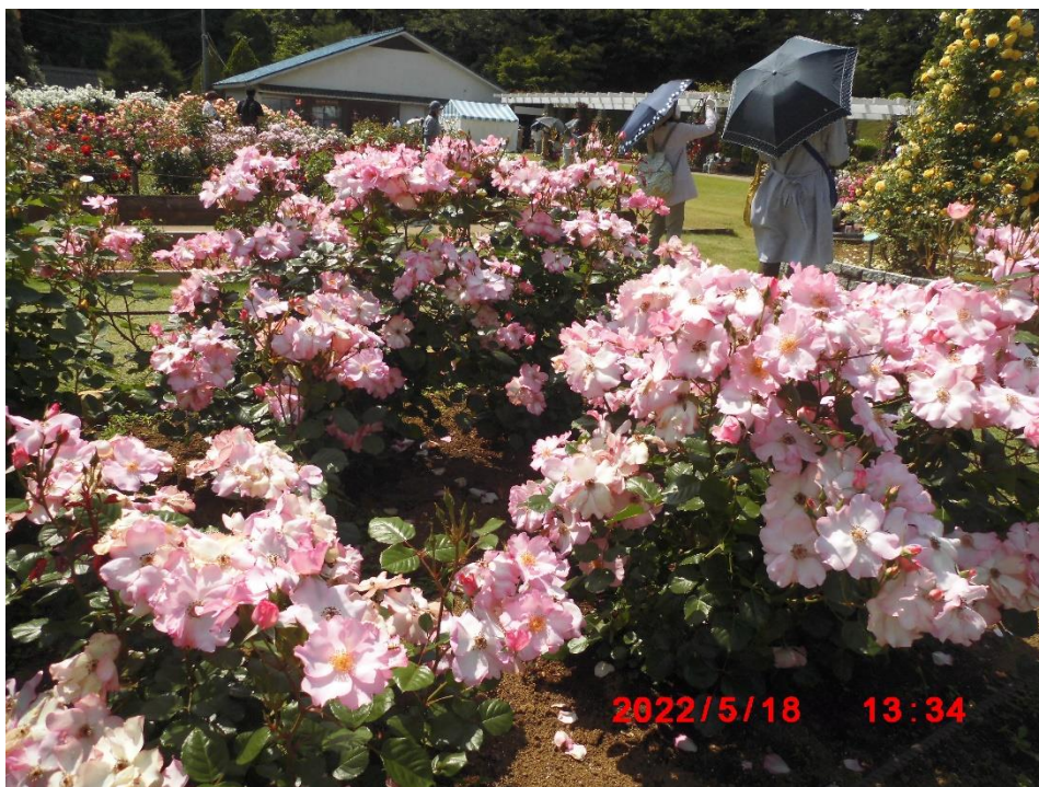
ブレイズ・オブ・グローリー オランダ 2005年