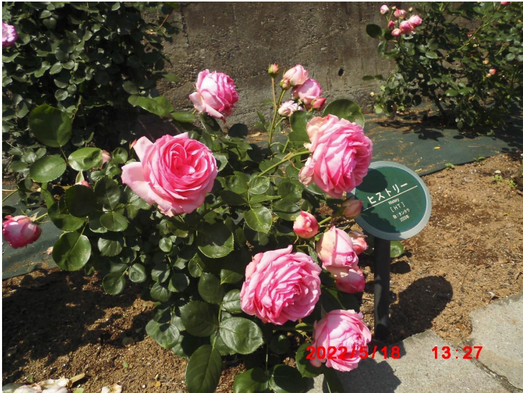
ヒストリー 香りはしないようです。ドイツ 2003年