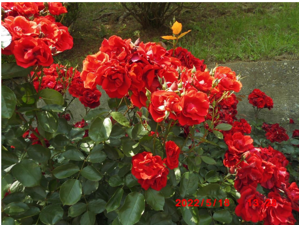
トルナード ドイツ 1973年