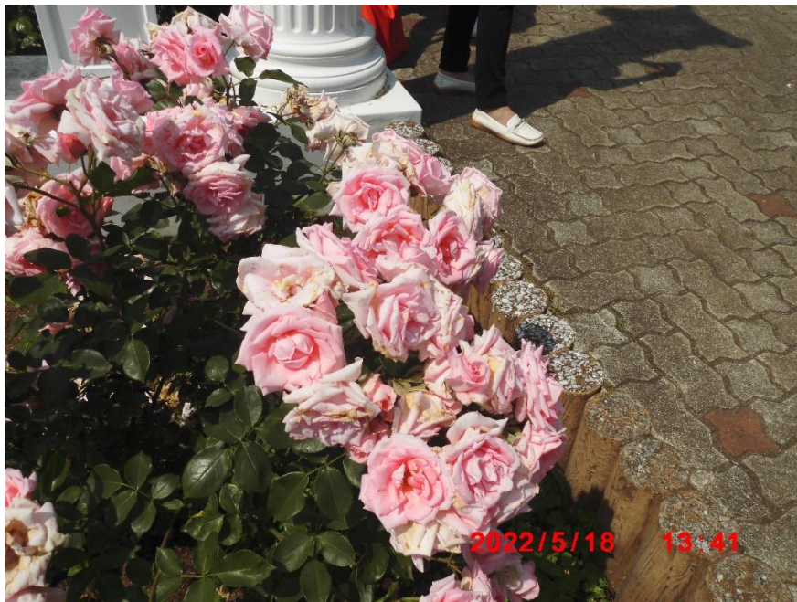
プリンセス・アイコ 日本 2002年 マサコ様の薔薇がないのは諸説あって作らなかったようですが残念ですね。