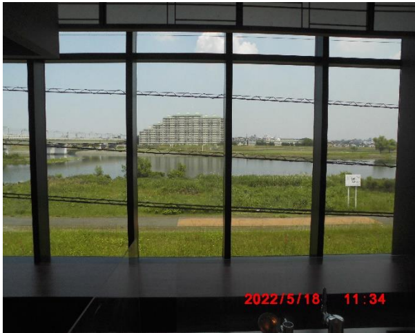
食堂の向こうに多摩川が広がる