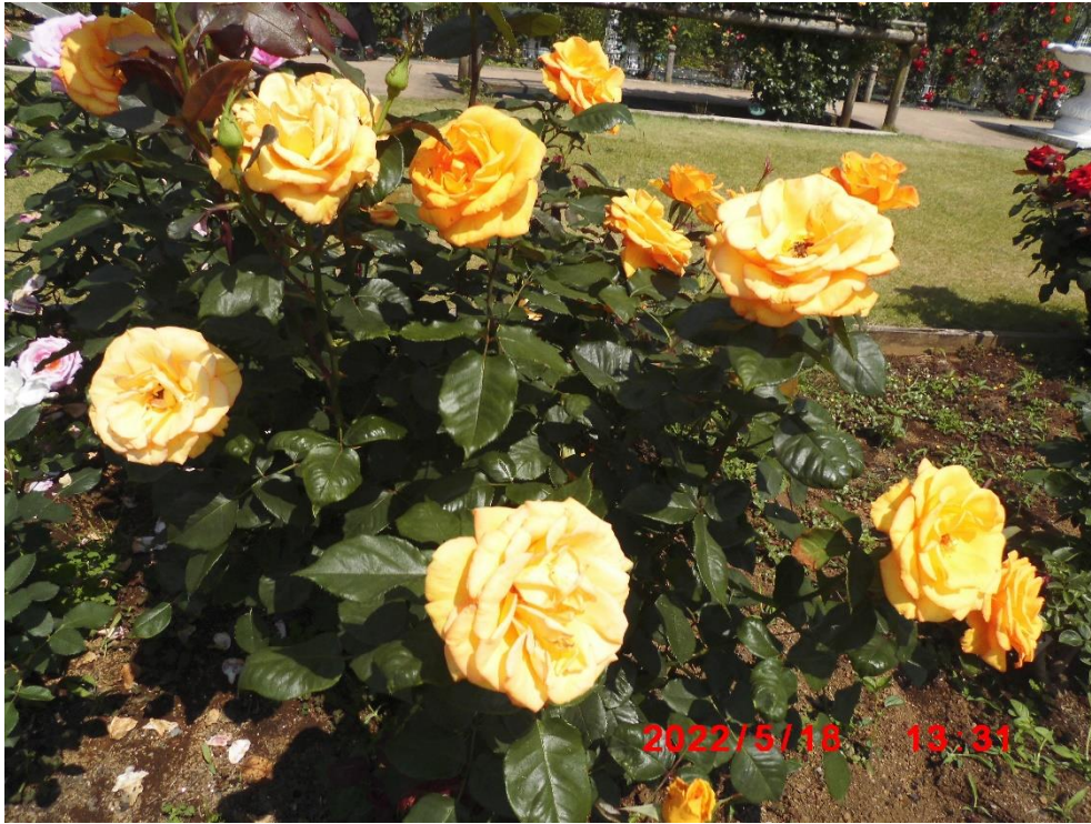
サンダンス アメリカ 2004年 何となくアメリカという雰囲気を感じるの薔薇ですかね。