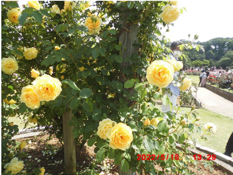
グラハム・トーマス イギリス 1983年 2009年殿堂入り。作者の師の名にちなんで命名。深いカップ咲きで、強いティー系の芳香がするとの事。看板より。