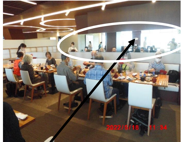
ランチ風景。多摩川に背を向けた椅子の前面には鏡が設置されていて、背を向けた人も多摩川が見えるという心憎い演出もされていました。