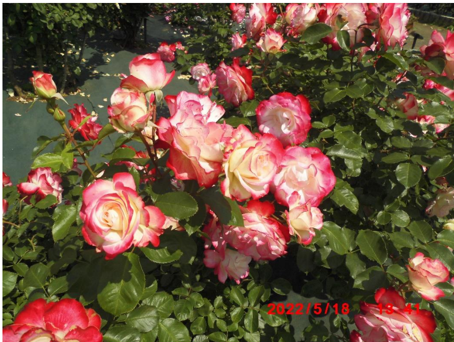
ジュビレ デュ プリンス ドゥ モナコ フランス 2000年