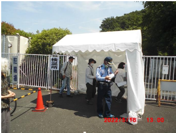
ばら苑入口で検温と手の消毒