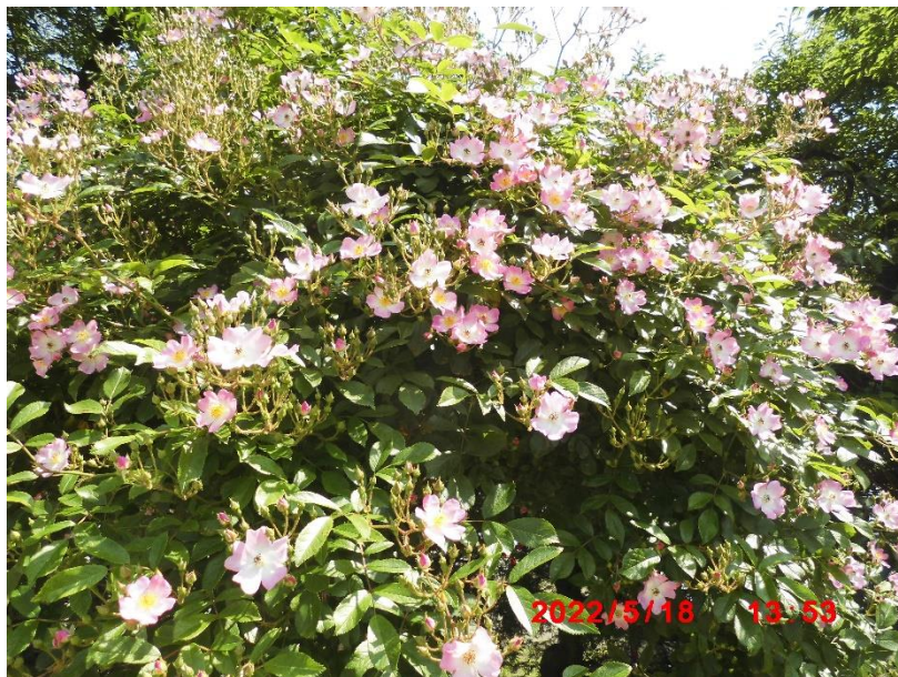
バレリーナ 妖精のような可愛らしさで人気があるようです