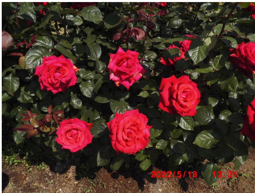
グランデ・アモーレ ドイツ 2004年 真っ赤な薔薇で薔薇らしい薔薇ですね。