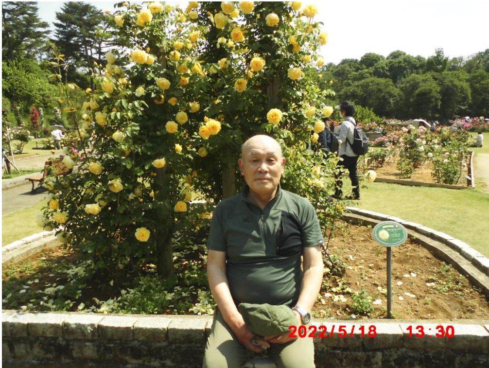
何か悟りをした人に見えますね。本人が言うには遺影だそうです。