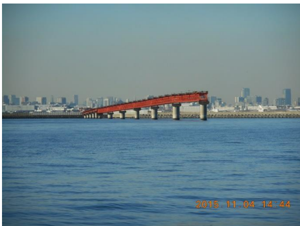
飛行機の誘導ライン