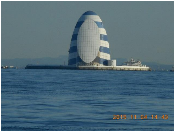
東京湾アクアラインの風の塔。平山郁夫さんのデザインとの事。