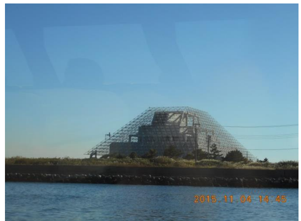
浮島側のアクアラインの換気塔。羽田空港の第4滑走路ができたため空域制限で頭部の1/3を切り取ったと説明がありました。