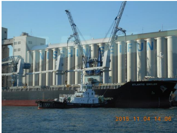
日清製粉鶴見工場