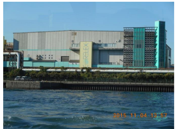
ゼロ・エミッション工業団地