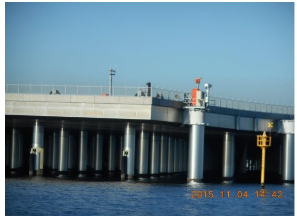
新第4滑走路は栈橋構造と埋め立てを組み合わせたハイブリッド構造との説明がありました。