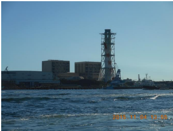
東京電力東扇島火力発電所 200 万 kW