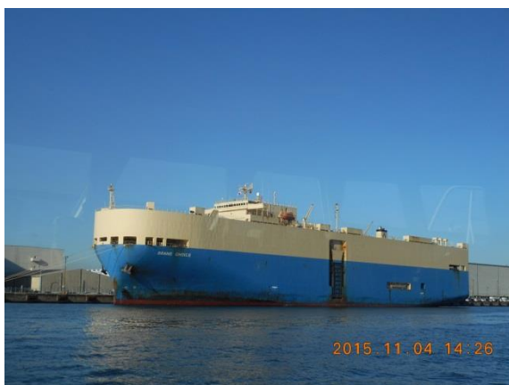
東扇島物流センターの自動車船積 4,000 台ほどの車を積み込める船との説明がありました。スバル車でした。