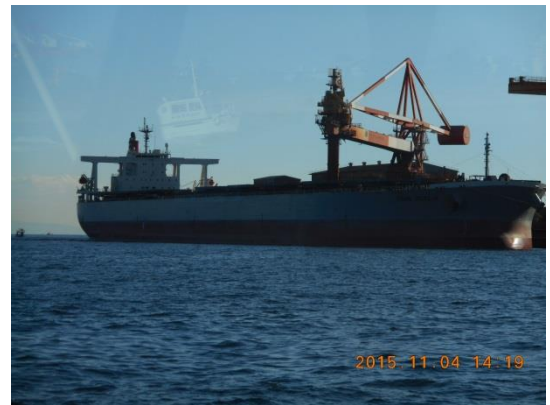
J F E スチール原料岸壁の船 20 万等級との事