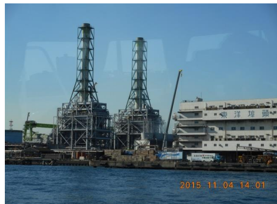
川崎天然ガス発電所 約 84 万 kW