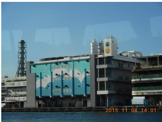
東洋ふ頭 壁にパイナップルの絵が描いてあると説明がありました。