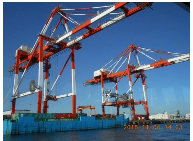
コンテナふ頭のガントリークレーン