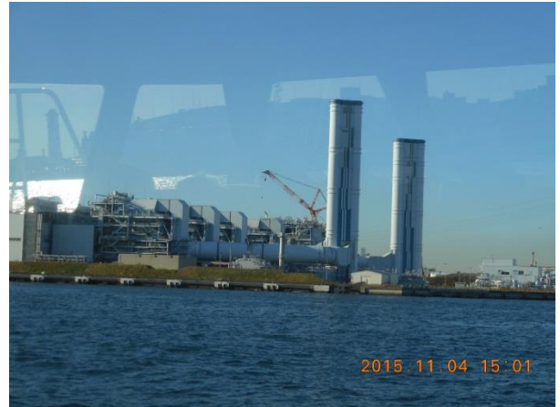
東京電力川崎火力発電所 200万kW