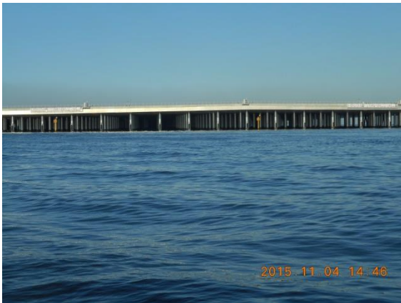
羽田空港新第4滑走路の栈橋構造の杭群。滑走路は2,500mと説明がありました。