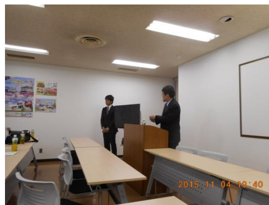
日本食肉流通センターでビデオ及び担当者の方から説明をお聞きする参加者の皆さん。