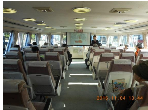
川崎市港湾局の船。あおぞらに乗り込みます。総トン数 127 トン、長さ 25m、幅 6.2m、速さは 25 ノット、約 47km で航行することができるという。