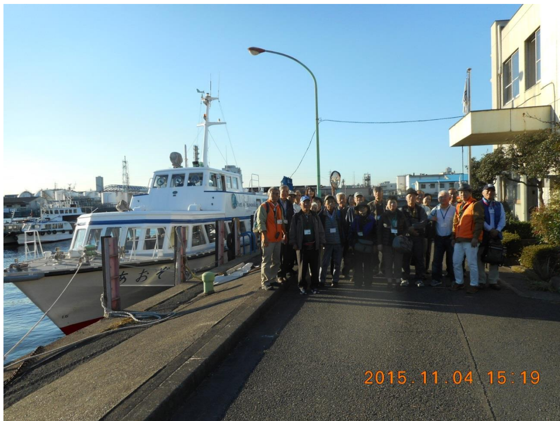
クルージング終了後の皆さんとの集合写真